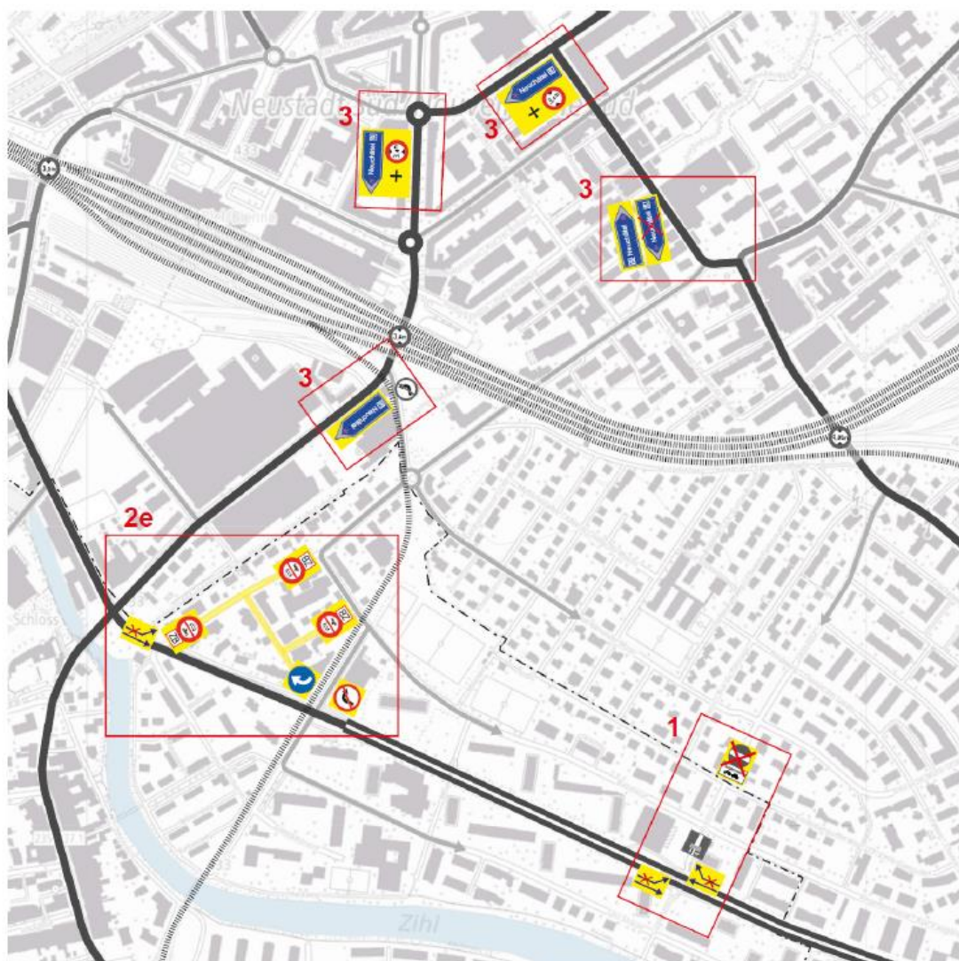
Abbildung 2: Bestvariante Gesamtlösungsansatz Verkehrsorganisation

und 3 mit der Massnahme 2e als zielführender Gesamtlösungsansatz eingestuft und im Rahmen der öffentlichen Mitwirkung (siehe unten) als Bestvariante vorgelegt. Nachfolgende Darstellung zeigt für die angepasste Verkehrsorganisation die Bestvariante mit der Massnahmenkombination 1 / 2e / 3.