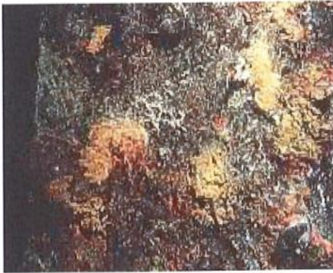
Unbehandelte Stahlführungsschiene mit starker Rostbildung und Bewuchs (Muschel)