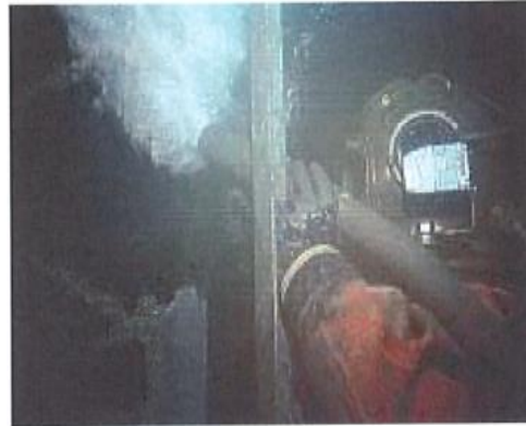
Taucher beim Sandstrahlen nach Hochdruckreinigung