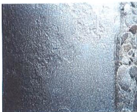
Sandgestrahlte Sohlendichtung (Stahl/Beton)