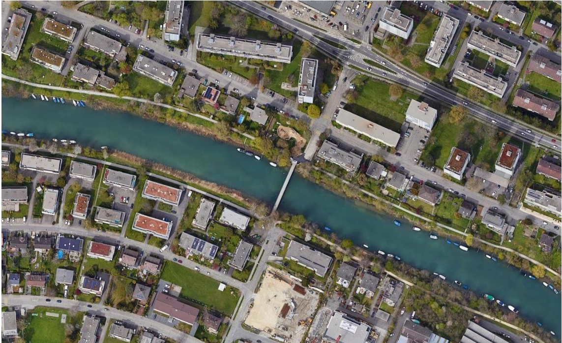
Abbildung 1: Standort Looslibrücke

Die Looslibrücke überquert die Zihl zwischen Fröschenweg und Reckweg. Das Bauwerk wurde zusammen mit dem Zihldüker im Jahr 1975 erstellt. Die Fussgängerbrücke besteht aus einer Stahlkonstruktion mit vorfabrizierten Fahrbahnbetonelementen. Die Brücke steht auf vier Stahlrohrpfeilern, welche auf dem Zihldüker fundiert sind.