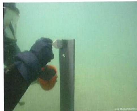
Taucher beim Anstrich